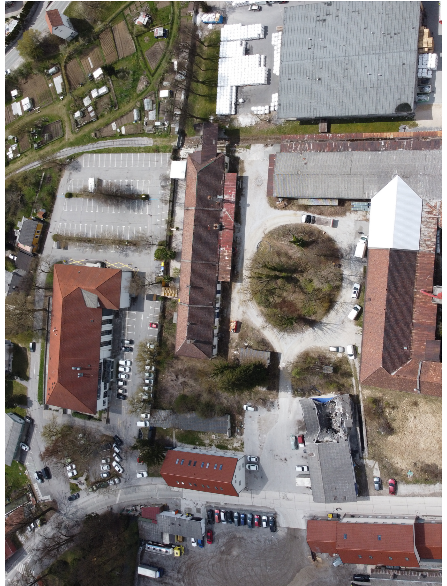
Območje Kreativne četrti Barutana, 2021.