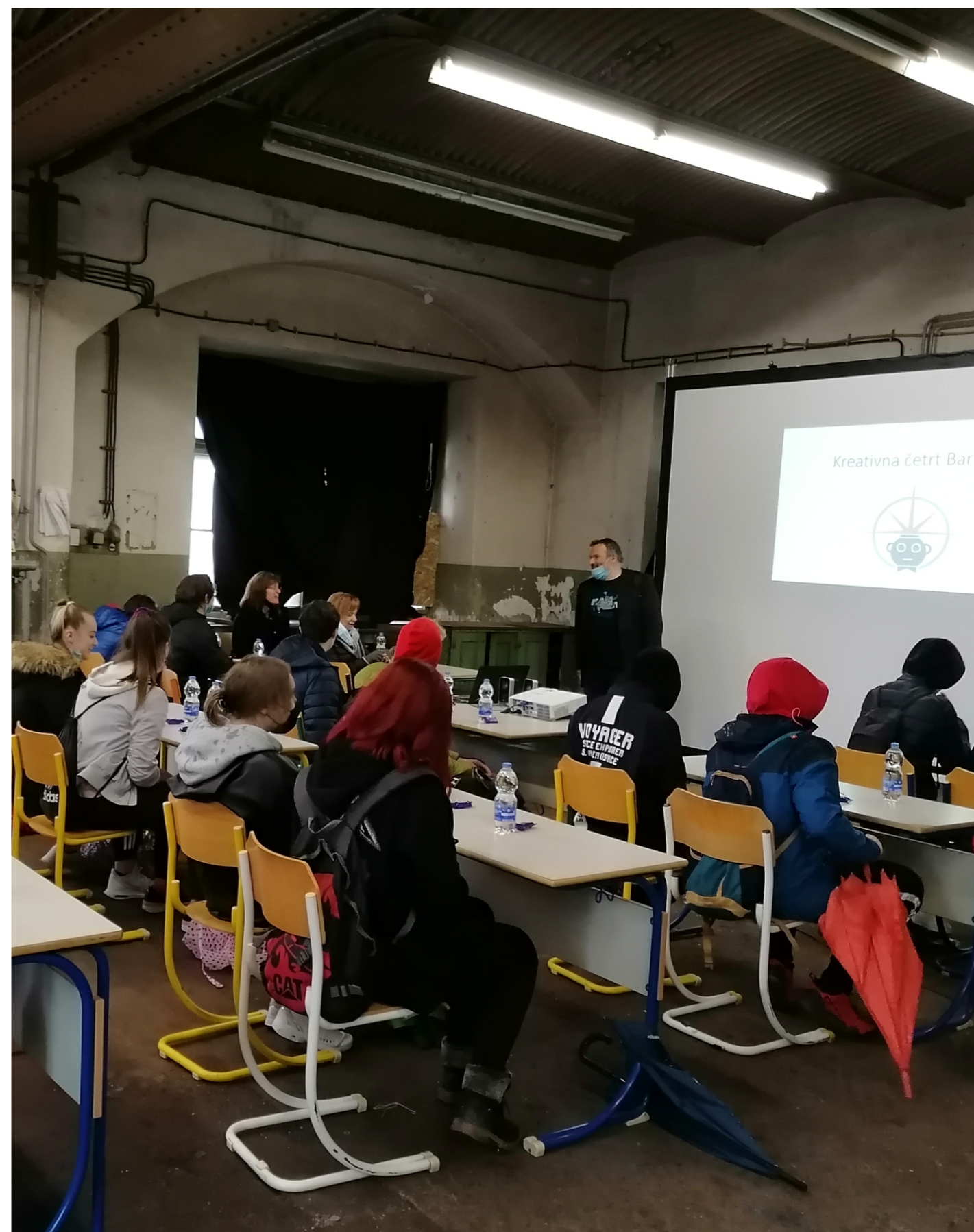
Predavanje za dijake v prostorih ključavničarstva, 2021.

DIIP = Dokument identifikacije investicijskega projekta