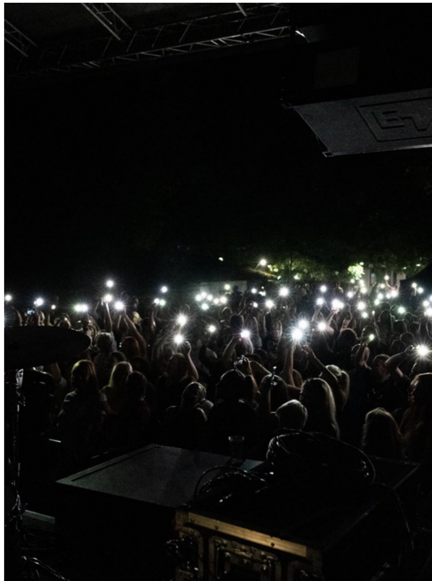
Kamfest 2022 v KČB.

Za izvajanje aktivnosti kulturno-umetniške produkcije in strokovnih srečanj bi potrebovali ustrezno infrastrukturo, med katerimi bi na podlagi potreb mladinskih organizacij in angažiranih posameznikov, ki so že dejavni na območju Kreativne četrti Barutana, najbolj potrebovali prireditveno dvorano, bar in sobo za bende, sejno sobo, prostor za razstave, prostor za druženje in zunanji prostor.