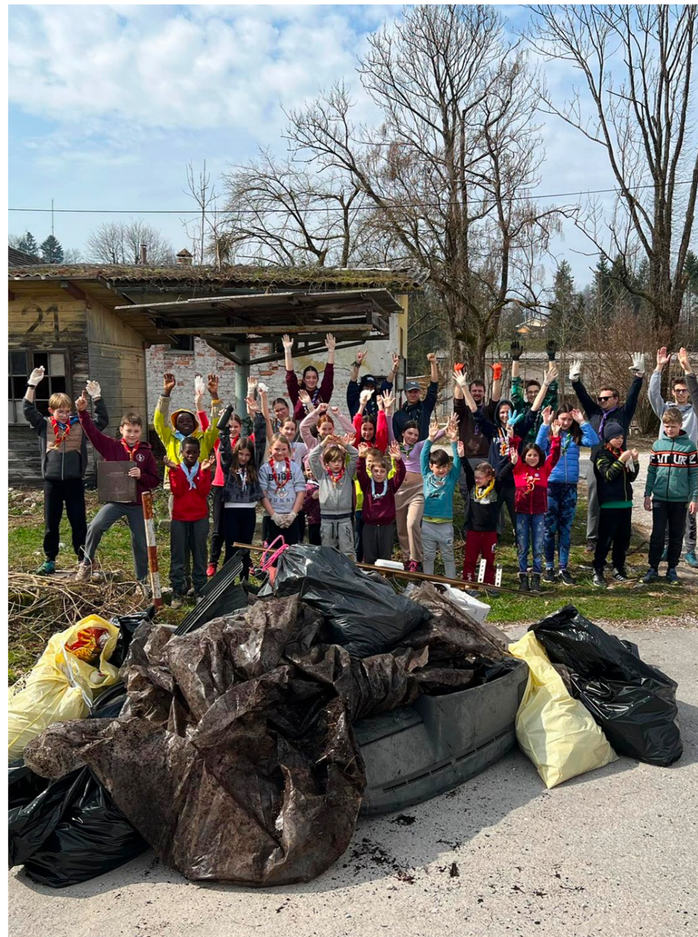
Čistilna akcija tabornikov, 2023.

Za izvajanje družabnih aktivnosti je največ anketirancev ocenilo, da bi potrebovali prostore za druženje, zunanji prostor, čajno kuhinjo ter bar, v nekoliko manjšem obsegu pa bi potrebovali še učilnico, prostor za razstave, sejno sobo ter prireditveno dvorano.